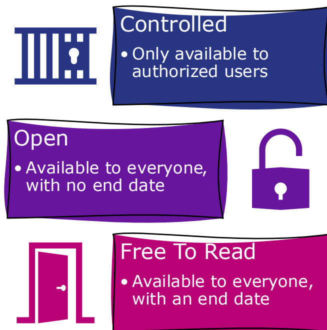
Figure 1. リリース5.1の3つのアクセスタイプ

アクセスタイプは、購読物とオープンアクセス、そして自由に読める出版物を区別するため使用されます。リリース5.1では、アクセスタイプの古い定義を一新し、より理解しやすくしました。