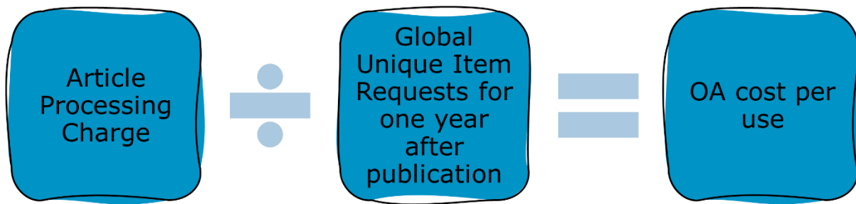
Figure 2. OA-Kosten pro Download

Hier ist allerdings Vorsicht geboten: Möglicherweise ergibt die Messung der Open Access-Kosten für das erste Jahr alleine keine valide Vergleichsbasis, da die Kosten für Inhalte, die im Open Access zugänglich gemacht werden sollen, eine Investition in unbefristete freie Verfügbarkeit darstellen.