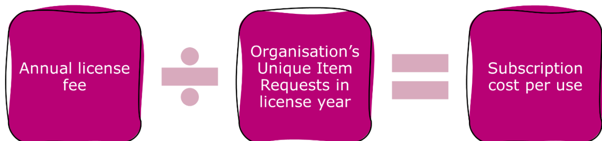
Figure 1. Abo-Kosten pro Download.

Traditionell wurden COUNTER-Nutzungsstatistiken von Bibliotheken als Basis dafür verwendet, die Kosten pro Download zu berechnen. Da jedoch ein immer größerer Anteil von wissenschaftlichen Publikationen im Open Access zugänglich ist, interessieren sich sowohl Bibliotheken als auch Geldgeber zunehmend für die entsprechenden Kalkulationen zu Open Access-Inhalten. Typische Kalkulationen sind: